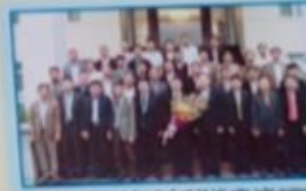
Hội Cựu chiến binh Cục Thuế và 50 hội viên toàn quốc ở Bắc Ninh chào mừng Hội Cựu chiến binh Cục Thuế Ninh Bình