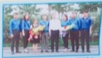
Ban chấp hành Cơ quan Thuế HCM Cup Thuế Ninh Bình, tháng 04/2019 (02/0)