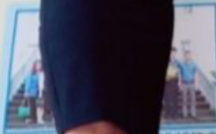
Tập thể Cơ quan Thuế Ninh Bình đang công bố kết quả công tác thu thuế năm 2018